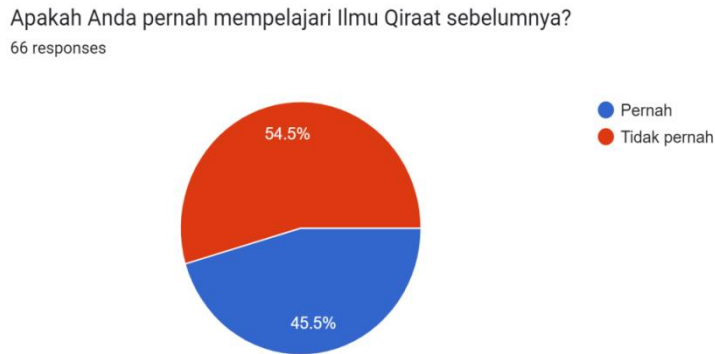
Diagram I. Hasil Jawaban Responden Pernah/ Tidak Pernah Mempelajari Ilmu Qiraat

Dalam penelitian ini, penulis menyebarkan angket pertanyaan pada mahasiswa/I Prodi IAT Semester III yang telah mendapatkan Mata Kuliah Ilmu Qiraat. Sebanyak 66 mahasiswa mengisi angket tersebut dan dari data yang diperoleh tergambar sebanyak 54,5% mahasiswa IAT tidak pernah mempelajari ilmu Qiraat sebelumnya. Sementara itu, sebanyak 45,5% pernah mempelajarinya. Berikut deskripsi bagannya: